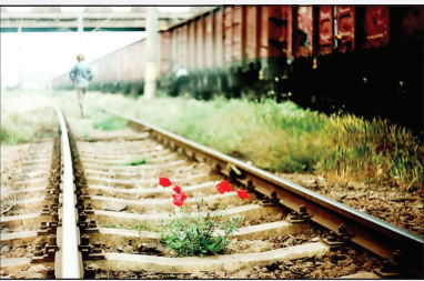
От Москвы до самых до окраин Стр. 13