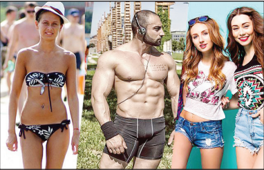
Оденьтесь, дамочка! Стр. 12