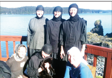
Православные американки с Аляски Стр. 15