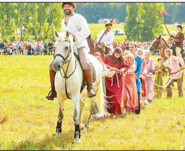
Фестивал "Воинно поле" в Калужской области Стр. 7